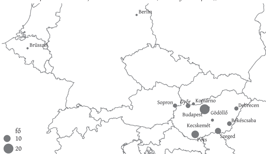
2. ábra: A Tér és Társadalom szerzőinek (munkahely szerinti) területi megoszlása, 2016 Spatial distribution of Tér és Társadalom authors (according to workplace), 2016

hasonlóan közülük legtöbben az MTA KRTK Regionális Kutatások Intézetében dolgozó kollégáink – szám szerint 24-en. Rajtuk kívül még négy 2016-os szerző kutat az MTA egyéb intézeteiben (Földrajztudományi Intézet, Szociológiai Intézet, Világgazdasági Intézet). Egyéb háttérrel rendelkező szerzőink jellemzően az állami és kormányzati szféra, valamint a magánszektor szakemberei.