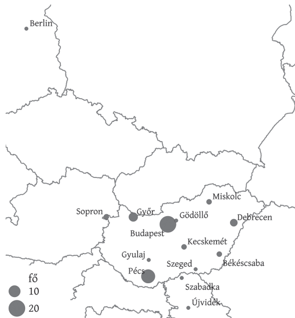
3. ábra: A Tér és Társadalom lektorainak (munkahely szerinti) területi megoszlása, 2016 Spatial distribution of Space and Society's reviewers (according to workplace), 2016

2011-es bevezetése óta még nem lektoráltak a Tér és Társadalom számára. A 2016. évi 4. szám írásait, amely Horváth Gyulára emlékezett, a szerkesztőség tagjai bírálták.