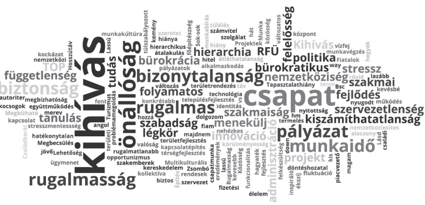
3. ábra: A válaszadók eszébe jutó első három szó jelenlegi munkahelyükről The first three mentions of respondents about their current workplace

A jelenlegi munkahely kapcsán is megkérdeztem, mi az első három szó, amely a válaszadó eszébe jut. A szófelhő (3. ábra) alapján csekély mértékű átfedés ugyan jelentkezik az RFÜ-s és a jelenlegi munkahely említéseiben (például csapat, fejlődés, pályázat, szakmai), ám a hangsúly főként a kihíváson, az önállóságon, a rugalmasságon, a felelősségen, a folyamatosságon, a biztonságon és függetlenségen van (amelyek kevésbé voltak az RFÜ-s és általánosságban a közgazdasági szektorban való munkavégzés sajátjai). Általánosságban megállapítható, hogy a szófelhő sokszínűbb, több a hangsúlyos kifejezés, de azok hangsúlya kevésbé erőteljes, mint a nagyon tiszta és erőteljes fókuszokkal rendelkező RFÜ-s szófelhőnél. Míg az RFÜ-k kapcsán az egyetlen negatívként értel-