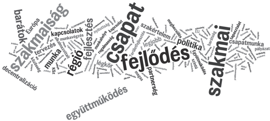
2. ábra: A válaszadók eszébe jutó első három szó az RFÜ-kről The first three mentions of respondents about the RDAs

Megkérdeztem a válaszadóktól, hogy mi az első három szó, ami az RFÜ-ről eszükbe jut. Fontos kiemelni, hogy – egy-két, főként a kiábrándultságból fakadó negatív kifejezésen kívül – a használt szavak egyértelműen és erősen pozitív töltetűek voltak (2. ábra).